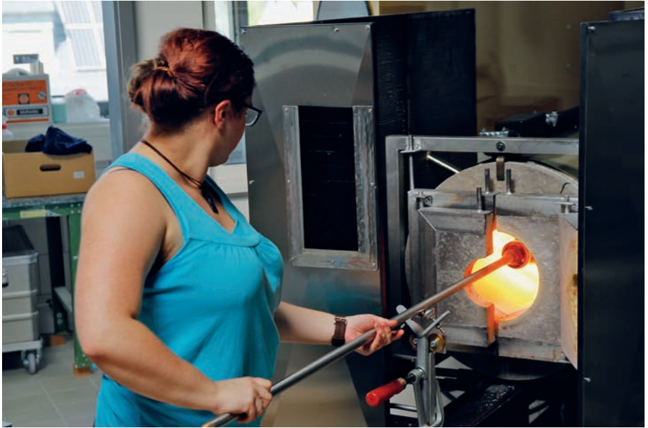
Glassymposium 2018, Heißglasofen in der Glasfachschule.

integriert worden und die Auszubildenden der Berufsfachschule für Glastechnik und Glasgestaltung nutzen diese Ausdrucksmöglichkeit immer wieder in ihren Entwürfen für den Internationalen Glaskunstpreis in Rheinbach. Dabei sind erste Ideen und Entwürfe für den Glaskunstpreis 2022 bereits entstanden und können in dem Workshop mit den Glaskünstlern weiterentwickelt werden.