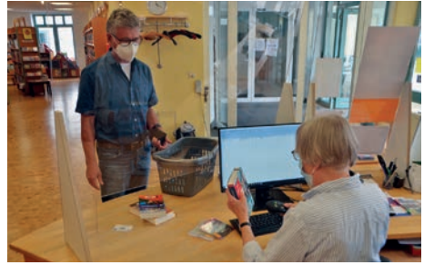
Gerade in der Coronazeit ist die Bücherei für viele Menschen ein wichtiger Anker.

Oberdrees) verfügt die Öffentliche Bücherei St. Martin als Vertragsbücherei über drei Festangestellte, die auf zwei Vollzeitstellen die Bücherei mit der notwendigen Professionalität leiten. Das umfangreiche Medien- und Veranstaltungsangebot, die Öffnung an fünf Werktagen sowie die intensive Zusammenarbeit mit Kitas, Schulen und weiteren Institutionen bei der Leseförderung werden auch durch eine große Zahl von Ehrenamtlichen möglich gemacht. Derzeit helfen rund 40 Menschen unentgeltlich dabei mit, dass die Bücherei ein nicht wegzudenkender Teil des Rheinbacher Bildungs- und Kulturangebots und damit ein wichtiger Standortfaktor ist. Von ihrer Lage im Herzen der Stadt profitieren nicht zuletzt auch Handel und Gastronomie.